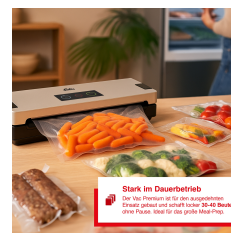
Stark im Dauerbetrieb Das Solis Premium ist für den Dauereinsatz. Erweitert geladert und schafft bis zu 30-40 Beutel ohne Pause. Ideal für alle großen Feiern.