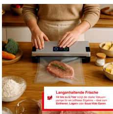
Langanhaltende Frische Mit bis zu 2,5 mm extra starke Versiegelung garantiert ein optimale Haltbarkeit - bis zu 30 Tage im Kühlschrank oder bis zu 12 Monaten im Gefrierfach.