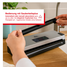
Bedienung mit Sauberkleptplus Aufwärtlich oder rückwärts abzurufen um das Sauberkleptplus zu aktivieren. Einfach auf "Hygienisches Bedienen ohne Aufsicht".