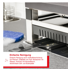
Einfache Reinigung Einfachste Reinigung durch Aufschiebung der Pfannen. Griffteile sind Top-Abwischen mit Wasser. Töpfechen sind handabwaschbar. Abwischen des Grill- und Fonduebereichs.