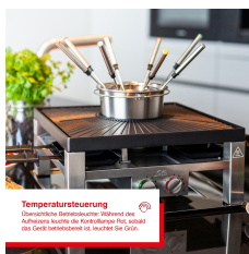
Temperatursteuerung Unabhängige Temperaturregelung über zwei Aufwände. Leuchte der Kontrollampe fließt, sobald das Grill-System eingeschaltet wurde. Die Lampe