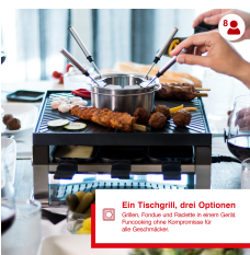
Ein Tischgrill, drei Optionen Grillen, Fondue und Raclette in einem Gerät. Funktioniert ohne Kompressor für alle Geistesländer.

Artikelnummer: S0129 EAN: 7611210977216 UVP: 299,90 EUR EK: nach Login