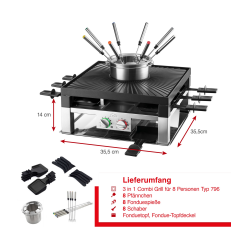
Lieferumfang 1 3 in 1 Combi Grill für 8 Personen Typ 796 2 Grillgitter 1 Fonduepfanne 1 Raclettepfanne 1 Fondue-Topf 1 Fondue-Topfhalter

Artikel-Abmessungen (LxBxH): 355 x 210 x 355 mm Gewicht (netto): 6530 g Karton-Abmessungen (LxBxH): 400 x 242 x 400 mm Gewicht (brutto): 7560 g