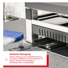
Einfache Reinigung Einfach: Reinigung durch Aufklappfunktion auf Fronte. Griffteile sind Top-Abwischen mit Wasser. Topdeckel mit herausziehbarer, abwaschbarer Gitter-Verkleidung.