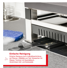
Einfache Reinigung Einfache Reinigung durch Aufschiebung der Pfannen. Griffteile sind Top-Abwärm- und Top-Platten sind mit Kunststoff beschichtet. Abwärm- und Top-Platten sind leicht abnehmbar.