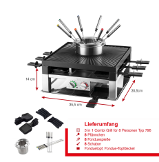
Lieferumfang 1x 3 in 1 Combi Grill für 8 Personen Typ 796 8x Raclette 1x Fonduepfanne 1x Grillgitter 1x Fondue- und Raclette-Topf

Artikel-Abmessungen (LxBxH): 355 x 210 x 355 mm Gewicht (netto): 6530 g Karton-Abmessungen (LxBxH): 400 x 242 x 400 mm Gewicht (brutto): 7560 g