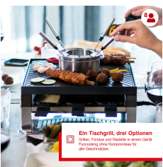
Ein Tischgrill, drei Optionen Grillen, Fondue und Raclette in einem Gerät. Funktioniert ohne Kompressor für alle Gezeiten.

Artikelnummer: S0129 EAN: 7611210977216 UVP: 299,90 EUR EK: nach Login