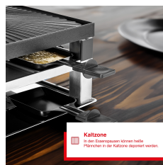
Kaltzone In der Kaltzone können heiße Pfannen in der Küche abgestellt werden.