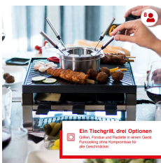
Ein Tischgrill, drei Optionen Grillen, Fondue und Raclette in einem Gerät. Funktioniert ohne Kompressor für alle Geschmäcker.

Artikelnummer: S0129 EAN: 7611210977216 UVP: 299,90 EUR EK: nach Login