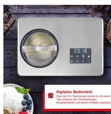
Digitales Bedienfeld Über das Pro Touchscreen könnt du mit einem Tipp zwischen den Vorwählungen, Menüspositionen und dem Gelatieren wechseln.