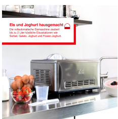
Eis und Joghurt hausgemacht Die vielseitigste der Eisarten zu machen. Bis zu 2 Liter köstliche Eiscreamen aus Solis, Gelato, Joghurt und Frozen Joghurt.

Artikelnummer: S0149 EAN: 7611210979265 UVP: 449,90 EUR EK: nach Login