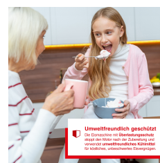
Umweltfreundlich geschützt Das Einbauelement (Überdruckgeschützt) macht den Betrieb mit der Freiluft- und umweltfreundlichen Kältemittel R600A, umweltschonenden Eiscremepumpen.