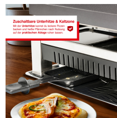
Zuschaltbare Unterhitze & Kaltzone Mit der Unterhitze können die Raclette-Pfannen beheizt und heiße Pfannkuchen nach Bedarf auf der praktischen Ablage warm gehalten.