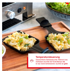
Temperatursteuerung Elektronische Temperaturregelung. Absenken des Aufhebers leuchtet die Kontrollleuchte rot, bei der Default-Einstellung leuchtet sie grün.