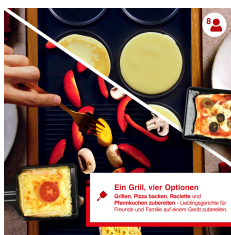
Ein Grill, vier Optionen Grillen, Pizza backen, Raclette und Pfannkuchen zubereiten - Leistungsstark für Personen und Familie auf einem Grill zuhause.

Artikelnummer: S0180 EAN: 7611210977612 UVP: 249,90 EUR EK: nach Login