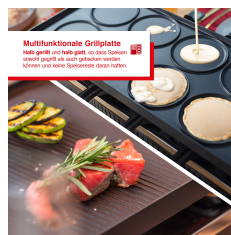
Multifunktionale Grillplatte Ideal geeignet um beide Grill- und Raclette-Stationen schnell und leicht zu wechseln. Schwenk- und extra Sperrriegel sorgen für mehr Flexibilität.