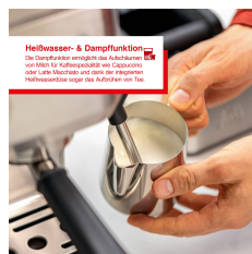
Heißwasser- & Dampffunktion Die Dampffunktion ermöglicht das Aufschäumen von Milch für Kaffeepezzielle wie Cappuccino oder Latte Macchiato und das Reinigen des Hochdruckboilers gegen das Aufkochen von Tee.