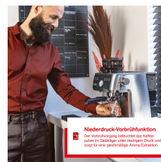
Niederdruck-Vorbrühfunktion Die Vorbrühfunktion verleiht dem Kaffee einen angenehmen Geschmack durch einen niedrigen Druck und sorgt für eine gleichmäßige Aroma-Extraktion.