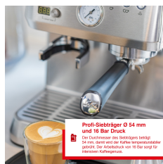
Profi-Siebträger Ø 54 mm und 16 Bar Druck Das Druckniveau eines baristischen Siebträgers beträgt 16 bar, damit sich der Kaffee temperaturstabil gießt. Der Auslass hat 16 Stufen für gleichmäßigen Kaffeeausfluss.