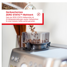
Geräuscharmes ZERO STATIC™-Mahlwerk Das neue ZERO STATIC™-Mahlwerk ist 23 Mal leiser als herkömmliche Mahlwerke, so dass Sie Ihren Kaffee perfekt genießen können.

Artikelnummer: S0200 EAN: 7611210980360 UVP: 799,90 EUR EK: nach Login