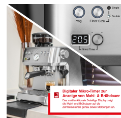
Digitaler Mikro-Timer zur Anzeige von Mahl- & Brühdauer Das hochauflösende 7-segmente Display zeigt die Mahl- und Brühdauer auf 0,1 Sekunden genau sowie die verbleibende Zeit.

Artikel-Abmessungen (LxBxH): 300 x 415 x 372 mm Gewicht (netto): 10163 g Karton-Abmessungen (LxBxH): 440 x 440 x 400 mm Gewicht (brutto): 11695 g