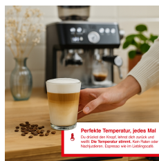
Perfekte Temperatur, jedes Mal Die perfekte Temperatur ist das Geheimnis für einen perfekten Kaffee. Die Temperatur ist entscheidend für den Geschmack.