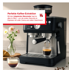
Perfekte Kaffee-Extraktion Die perfekte Kaffee-Extraktion ist das Geheimnis für einen perfekten Kaffee. Die Temperatur ist entscheidend für den Geschmack.