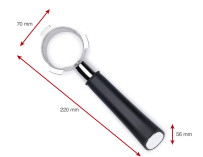
Lieferumfang Siebträger-Siebträger für Typ 1019 oder 1170

Artikel-Abmessungen (LxBxH): 22 x 9 x 7 mm Gewicht (netto): 372 g Karton-Abmessungen (LxBxH): 22 x 9 x 7 mm Gewicht (brutto): 500 g