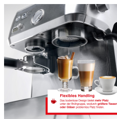
Flexibles Handling Das innovative Design bietet mehr Platz unter der Siebträger-Kanne, was auch größere Tassen oder Filterbehälter problemlos ermöglicht.