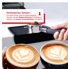
Verbessertes Tampen Das flache Siebträger-Boden sorgt für gleichmäßiges Tampen, was die Wasserverteilung im Kaffeebohnensatz verbessert und bessere Extraktionsergebnisse ermöglicht.