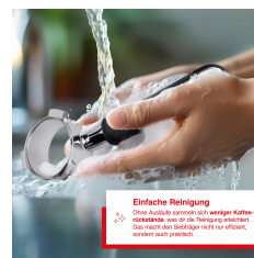
Einfache Reinigung Ohne Ausblei können sich weniger Kaffeebohnenreste an der Innenseite festsetzen. Das macht den Siebträger nicht nur effizienter, sondern auch gesünder.