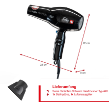
Lieferumfang • Swiss Perfection Swiss Haartrockner Typ 440 • 1x Schutzgitter, 1x Luftausgitter

Artikel-Abmessungen (LxBxH): 261 x 253 x 89 mm Gewicht (netto): 770 g Karton-Abmessungen (LxBxH): 245 x 216 x 89 mm Gewicht (brutto): 1010 g