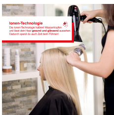
Ionen-Technologie Die Ionen-Technologie reduziert Wasserpartikel und lässt das Haar glänzen und glätten. Zudem spendet sie auch 24h lang Friseur.

Artikelnummer: S0316 EAN: 7611210968672 UVP: 99,90 EUR EK: nach Login