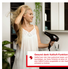
Gesund dank Kaltluft-Funktion Kalte Luft kann das Haar austrocknen, rauen und beschädigen. Die Swiss Perfection dank der Ionen-Kaltluft-Funktion ausstrahlt um das Haar schonend zu trocknen.