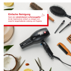
Einfache Reinigung Dank dem abnehmbaren Luftausgitter ist der Haartrockner einfach zu reinigen und sorgt für langanhaltende Leistung und Hygiene.