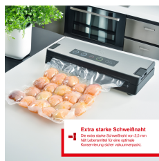
Extra starke Schweißnaht Die extra starke Schweißnaht von 2,5 mm ist Lebensmittelliste für eine optimale Konservierung großer Fleischmengen