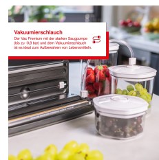
Vakuumschlauch Die 100 cm lange mit der abnehmbaren Schlauchleitung ist zu 100% aus dem Vakuumschlauch und ist leicht zum Abwaschen und zu reinigen