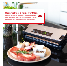
Dauerbetrieb & Pulse-Funktion Für die Premium-Serie sind für Dauerbetrieb (30-40 Tüten) und die Pulse-Vakuumierfunktion auch für empfindliche Speisen, wie Getreide.