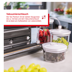
Vakuumschlauch Das SVS Premium hat den flexiblen Schlauch (20 x 40 cm) und eine Vakuumschlauch-Öse, die leicht zum Anstecken von Lebensmitteln.