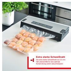
Extra starke Schweißnaht Die extra starke Schweißnaht von 2,5 mm ist lebensmittel für eine optimale Konservierung sicher verschlussfest.