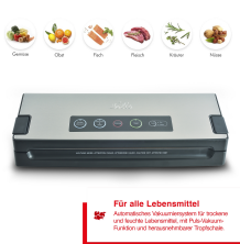
Für alle Lebensmittel Automatische Membranen für robuste und kurze Lebensmittel, die Puls-Vakuumierfunktion und temperaturgenaue Heißlufttrocknung.

Artikelnummer: SB0101 EAN: 7611210011590 UVP: 214,90 EUR EK: nach Login