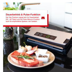
Dauerbetrieb & Pulse-Funktion Für die Premium-Serie sind für Dauerbetrieb (30-40 Tüten) und die Pulse-Vakuumierfunktion auch für empfindliche Speisen, wie Getreide